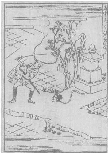
图2 胴体から頭部が離れた女の図。頭の後部より筋あるいは蒸気のようなものが見える(『諸国百物語』)