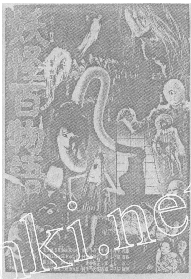
图1 映画「妖怪百物語」ポスター

最先采用“妖怪学”这个术语的，是在这方面研究卓有成效的被誉为“妖怪博士”的哲学家井上园了。他在明治十九年(1886年)创建了“不思议研究会”，次年便以“不思议室主人”的名义刊行了他的《妖怪玄谈》。1891年，妖怪研究会成立，然后到全国各地讲演，搜集各种怪谈、怪异资料，并于1893年至1894年刊行了他的大作《妖怪学讲义》，使妖怪学研究在日本流行起来。到了1923年，这一研究又出现了新的视点，江马务从历史学的角度推出了他的《日本妖怪变化史》，通过对妖怪形象变化的分析，探讨人的主观感情和客观社会存在变化的现象，得出古人认为怪异的“幻化物”今人也不一定认为是“妖怪”的结论。1936年，柳田国男又从民俗学的角度，研究这些怪异、怪谈，发表了他的《妖怪谈义》，现收在《柳田国男全集》第6卷中。他认为，妖怪和幽灵不同，妖怪是神沦落到凡间，出没在旷野，幽灵则是附着于人身的阴魂。他们采集了全国的妖怪种目，于1939年出版了《全国妖怪事典》。从